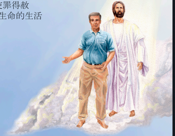
復活進 入新生命的生活